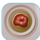
• szabálytalan sztóma