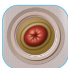
• ovális sztóma