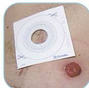
• sztómamérő sablon

A tapadófelület, azaz az alaplap és a zsák szerves egységet alkot. Az egyrészes termékeket gyakrabban kell cserélni, higiéniai szempontból is ajánlatos naponta legalább kétszer. Észrevétlenül biztonságot nyújt bármilyen ruha alatt, felhelyezése egyszerű. Egyrészes zsák létezik zárt, nyitott és urosztómás kivételben – gyermekek számára is kapható. Mindegyik zsáktípus többféle méretben, átlátszó és testszínű változatban is kapható. Létezik méretre vágható tapadófelületű zsák, melyet a saját sztóma méretéhez igazíthat és vannak fix méretű ún. előre kivágott zsákok is. A méretre vágható zsákokat egy ún. sablon és olló segítségével vághatja ki.